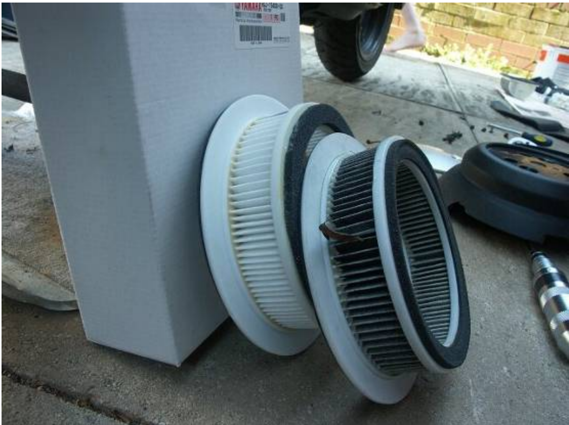
- Anche qui la differenza è evidente.