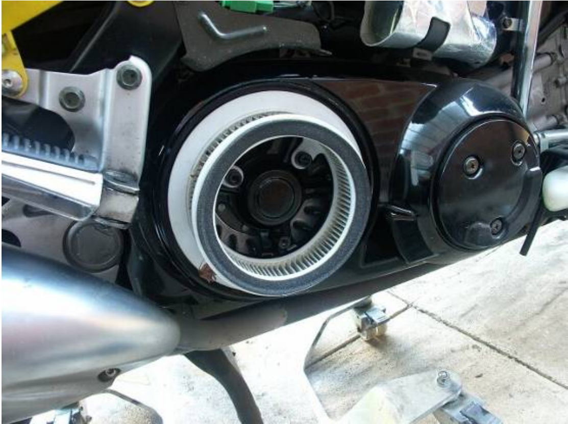
- Ecco a vista (foto sopra) il secondo filtro aria.